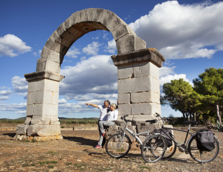
ARC ROMÀ DE CABANES